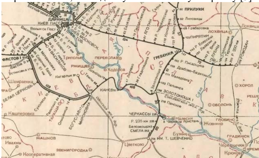
Рис. 1 Карта залізничних доріг СРСР 1943 року де чітко бачимо зазначений робочий маршрут, а також ділянку будівництва в напрямку Глобіно [3].

Від Новомосковська до Канева будівництво проводилось до 1941 року. Тут був побудований міст через Дніпро в районі Канева (виведений з ладу відступаючими німецькими військами в 1943 році) і ділянка Золотоноша – Миронівка. Завдяки цьому, через наше місто навіть ходив кільцевий пасажирський потяг Київ-Фастів-Миронівка-Золотоноша-Гребінка-Київ, як в одному так і в іншому напрямку [3].