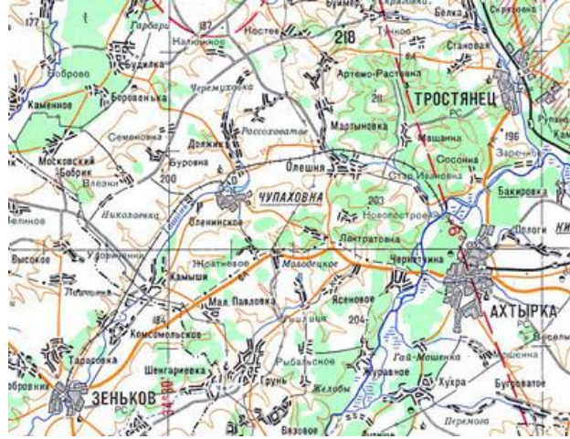
Рис. 3 Демонтована вузькоколія Зінків-Охтирка [3].

Залізничне сполучення в Гадячі з'явилося наприкінці 19 сторіччя. Цьому сприяв тодішній міністр шляхів сполучення Російської імперії Аполлон Костянтинович Кривошеїн, який мав у цій місцевості маєток. Будівництво Гадяцької під'їзної колії нормальної ширини було дозволено Комітетом Міністрів 1 червня 1893 року, а вже 15 жовтня 1894-го дільниця Лохвиця — Гадяч відкрилася для правильного руху. Спорудження лінії мало продовжуватись, але, на жаль, попри всі плани, станція Гадяч так і залишилась тупиковою.